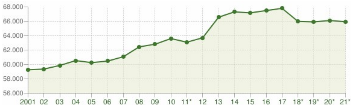
Andamento della popolazione residente

In generale, come riportato dai dati riguardanti l'andamento demografico della popolazione residente nel comune di Viterbo dal 2001 al 2021 (Grafici e statistiche su dati ISTAT al 31 dicembre di ogni anno), si nota un andamento della popolazione in continua crescita, soprattutto a partire dal 2012 che si stabilizza poi sui valori attuali