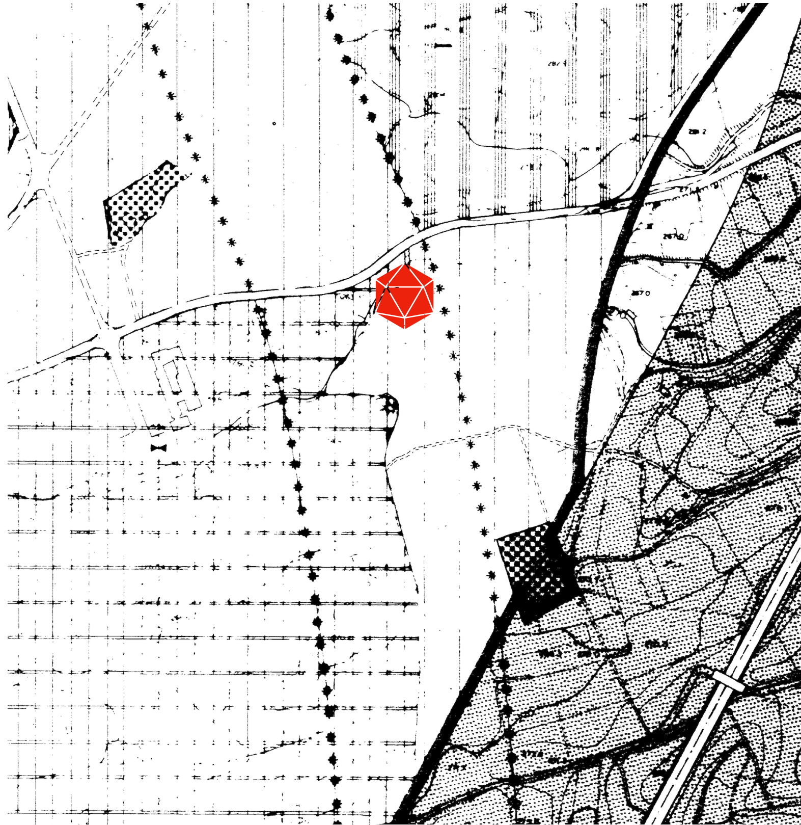
Stralcio Piano Regolatore Generale